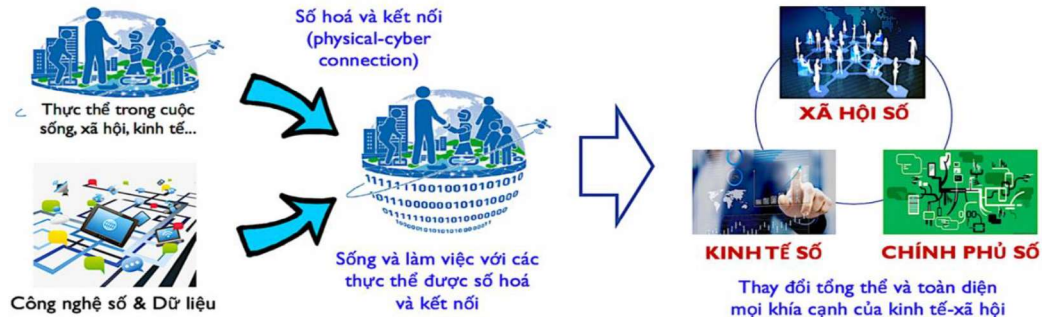
Hình 3: Chương trình chuyển đổi số quốc gia hướng đến xây dựng một chính phủ số, nền kinh tế số và một xã hội số ( Hồ và cộng sự, 2020 )

Chương trình Chuyển đổi số quốc gia đặt mục tiêu xây dựng thành công một Chính phủ số, một nền kinh tế số, và một xã hội số. Chính phủ số là chính phủ đưa toàn bộ hoạt động của mình lên môi trường số, không chỉ nâng cao hiệu lực, hiệu quả hoạt động, mà còn đổi mới mô hình hoạt động, thay đổi cách thức cung cấp dịch vụ dựa trên công nghệ số và dữ liệu, cho phép doanh nghiệp cùng tham gia vào quá trình cung cấp dịch vụ.