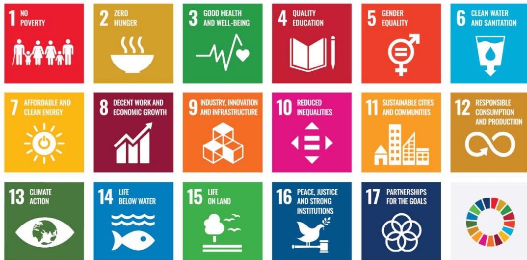
Hình 1: 17 Mục tiêu phát triển bền vững

Hình 1 giới thiệu 17 mục tiêu phát triển bền vững bao gồm: 78 xoá nghèo (SDG1), không còn nạn đói (SDG2), sức khoẻ và chất lượng sống tốt (SDG3), giáo dục có chất lượng (SDG4), bình đẳng giới (SDG5), nước sạch và vệ sinh (SDG6), năng lượng sạch với giá thành hợp lý (SDG7), công việc tốt và tăng trưởng kinh tế (SDG8), công nghiệp, sáng tạo, và phát triển hạ tầng (SDG9), thu hẹp bất bình đẳng (SDG10), đô thị và cộng đồng bền vững (SDG11), tiêu thụ và sản xuất có trách nhiệm (SDG12), hành động về khí hậu (SDG13), tài nguyên và môi trường biển (SDG14), tài nguyên và môi trường trên đất liền (SDG15), hoà bình, công lý và các thể chế mạnh mẽ (SDG16), quan hệ đối tác vì các mục tiêu (SDG17). 79 Để cụ thể hoá việc thực hiện, từ 17 mục tiêu tổng quát (goals), LHQ đã xây dựng thành 169 mục tiêu cụ thể (targets) với 231 chỉ tiêu thống kê (indicators). Tuy nhiên, các quốc gia có thể bản địa hoá các chỉ tiêu thống kê phát triển bền vững (SDIs) tương thích với SDGs của Chương trình nghị sự 2030. Một vài ví dụ điển hình như Liên minh châu Âu (EU) có bộ SDIs gồm 134 chỉ tiêu